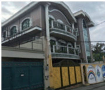
① フィリピン研修所