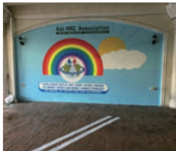
② 実技研修スペース