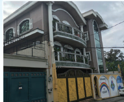
●実技／座学施設と宿泊施設を備えた5階建て自動車整備訓練所