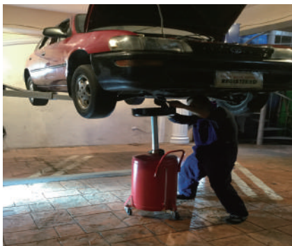
●リフト利用のオイル交換テスト

あいおい人材交流協会がご案内する人材は全て現役メカニックですが更にスキルテストを行い合格した技術レベルの高い人材のみ皆様の面接に参加させています。