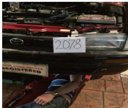
●リフト無しのオイル抜きテスト