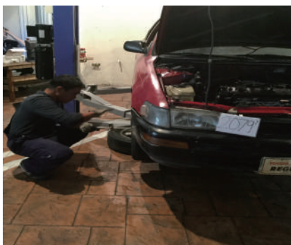
●タイヤ交換テスト