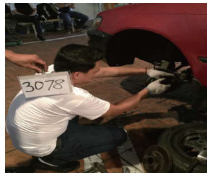
●ブレーキパッド交換テスト