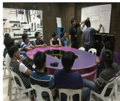
●自動車整備訓練所内にての座学